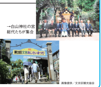
→白山神社の宮総代たちが集合