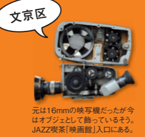
元は16mmの映写機だったが今はオブジェとして飾っているそう。JAZZ喫茶「映画館」入口にある。

古くから東洋大学をはじめ多くの学校を有する、緑豊かな文京エリア。ちょっと中に入ると閑静な住宅街が続き、大通り沿いの喧騒がウソのよう。白山神社ではあじさいまつりも開催され、多くの人で賑わいます。