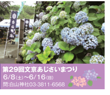
第29回文京あじさいまつり 6/8(土)~6/16(日) 問:白山神社03-3811-6568