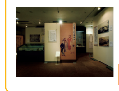
常設展と特別展がある 開館時間:9:30~16:45(土~12:45) 休館日:日・祝、その他学校が定める休業日 http://www.toyo.ac.jp/site/museum/

東洋大学の正門から「雨水(ほすい)の森」と名付けられたアプローチを抜けていくとあらわれる「井上円了記念博物館」(5号館1F)。東洋大学の創立者にして「妖怪博士」の異名を持つ井上円了の自筆原稿や旧蔵品のほか、大学が所蔵するさまざまな資料を展示している。無料で一般公開しているので、散策のついでに立ち寄ってみては。